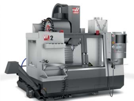
Haas VF 2

Stroje CNC Haas jsou pomyslným etalonem pro obráběcí výrobu a provoz. V našem případě se konkrétně jedná o vertikální obráběcí plně vybavené centra řady VF. Tyto CNC obráběcí stroje jsou konstruovány a sestavovány v kalifornském Oxnardu (USA) a zaručují tak trvanlivost i přesnost a kvalitu výroby.