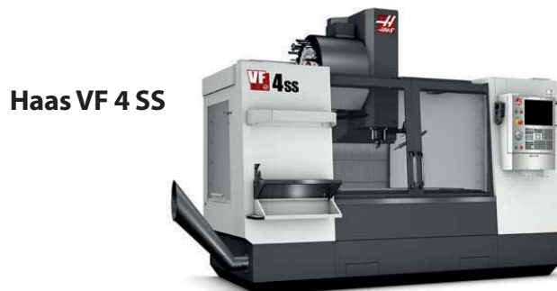
Haas VF 4 SS